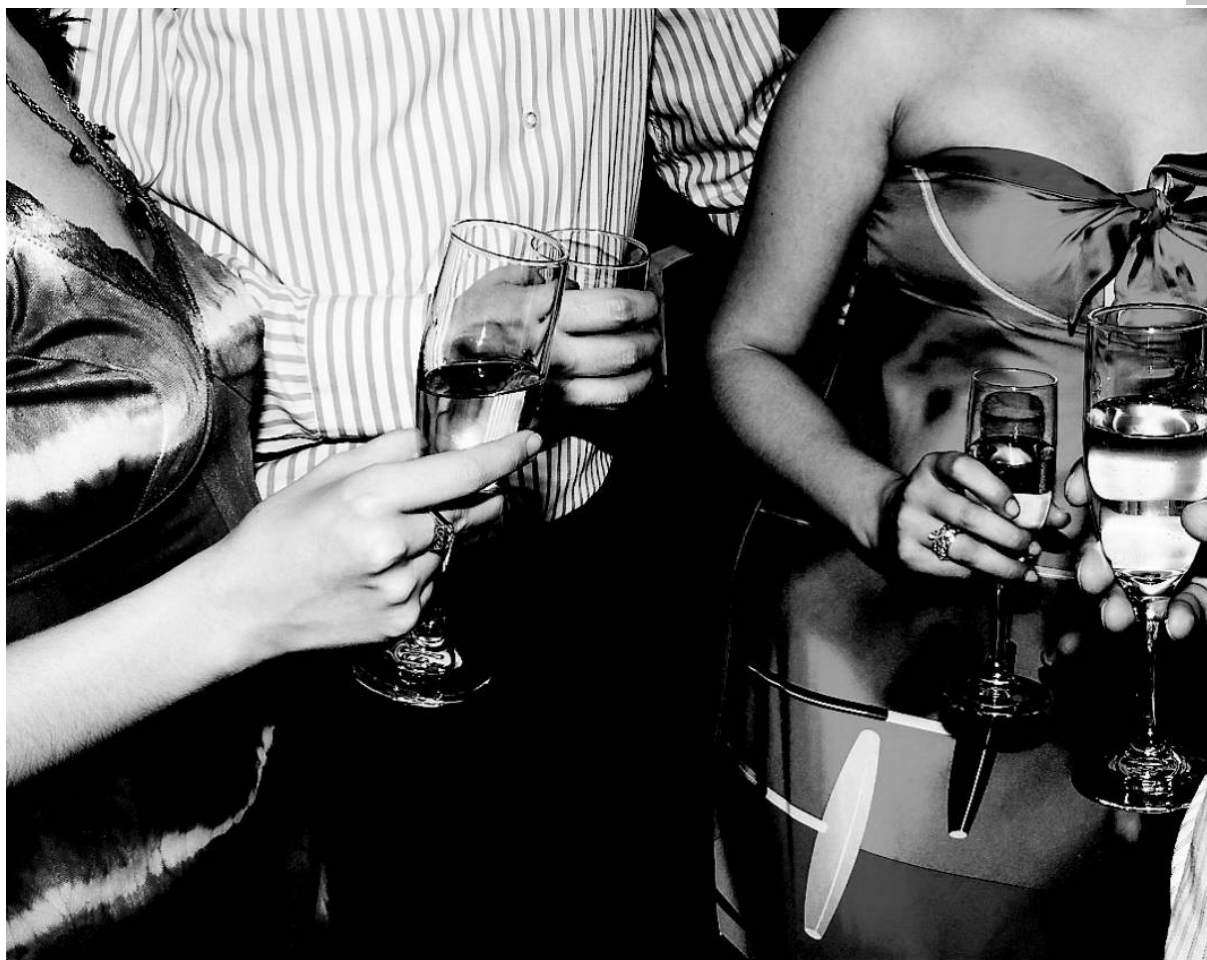
I New York är man alltid på jakt efter nya och ovanliga festlokaler.

Allt om mat till barnen från kalas till vardag • www.tasteline.com/barnochfamilj