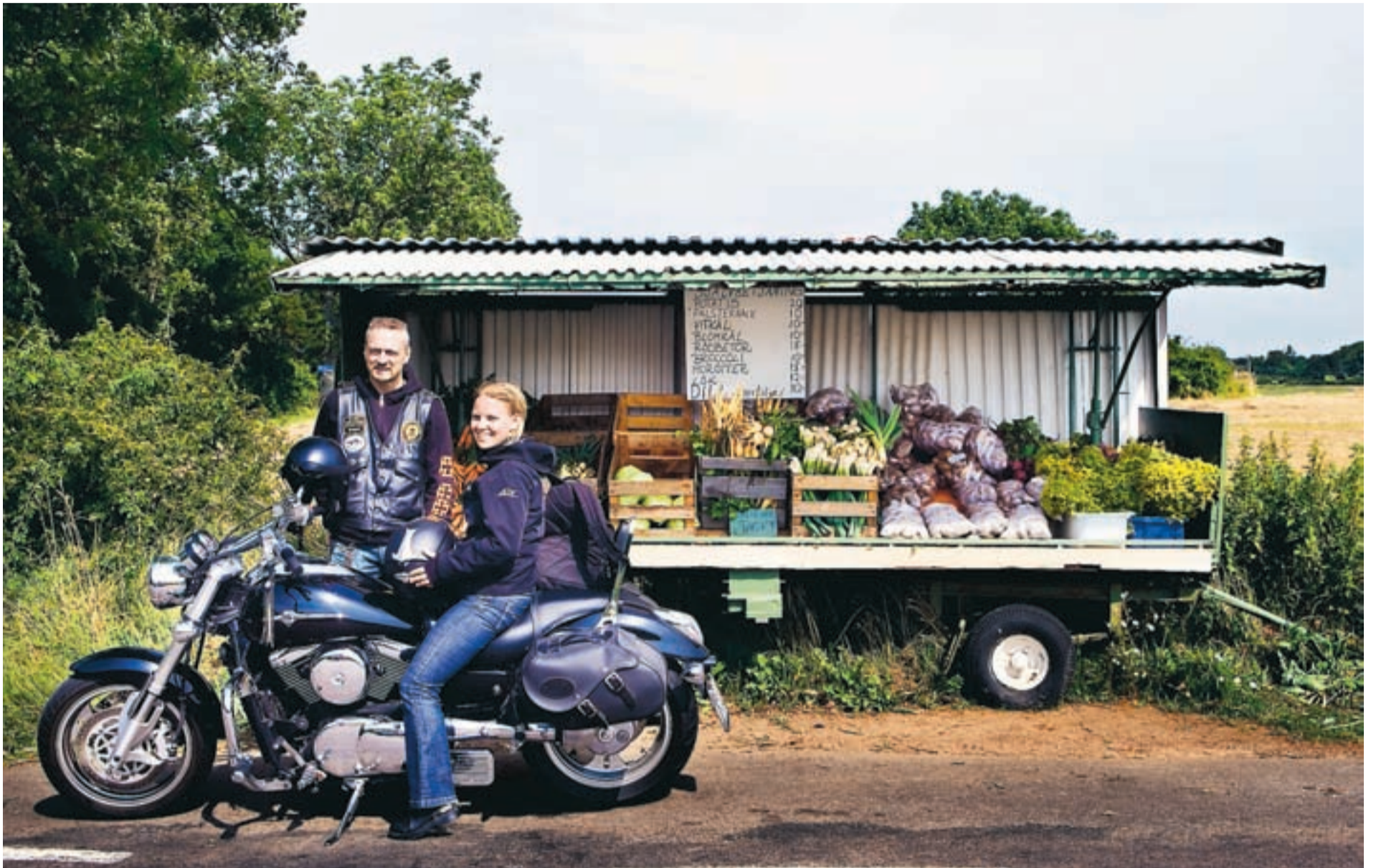
Grönsaker direkt från gården. Det här paret var på väg till Hovs hallar och passade på att fylla ryggsäcken med rödbetor, potatis och kritvit blomkål. Pengarna lägger man i en låda.